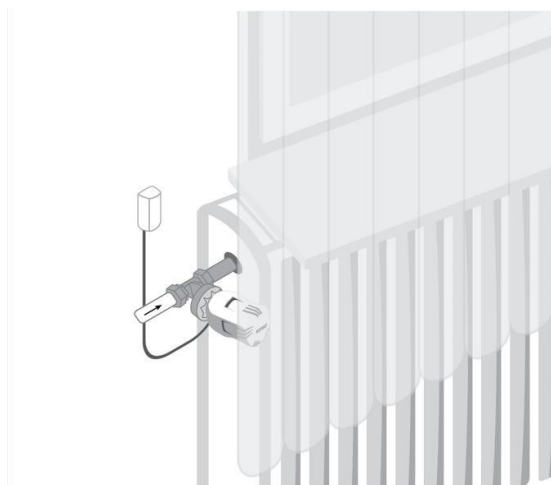
Рисунок 2 – Схема монтажа

Монтажное положение термоголовки, не влияет на её функционирование. В случае установки в вертикальном положении возможна некорректная работа вследствие воздействия на сильфон с термочувствительной жидкостью нагретых потоков воздуха (от поверхности труб или радиатора),